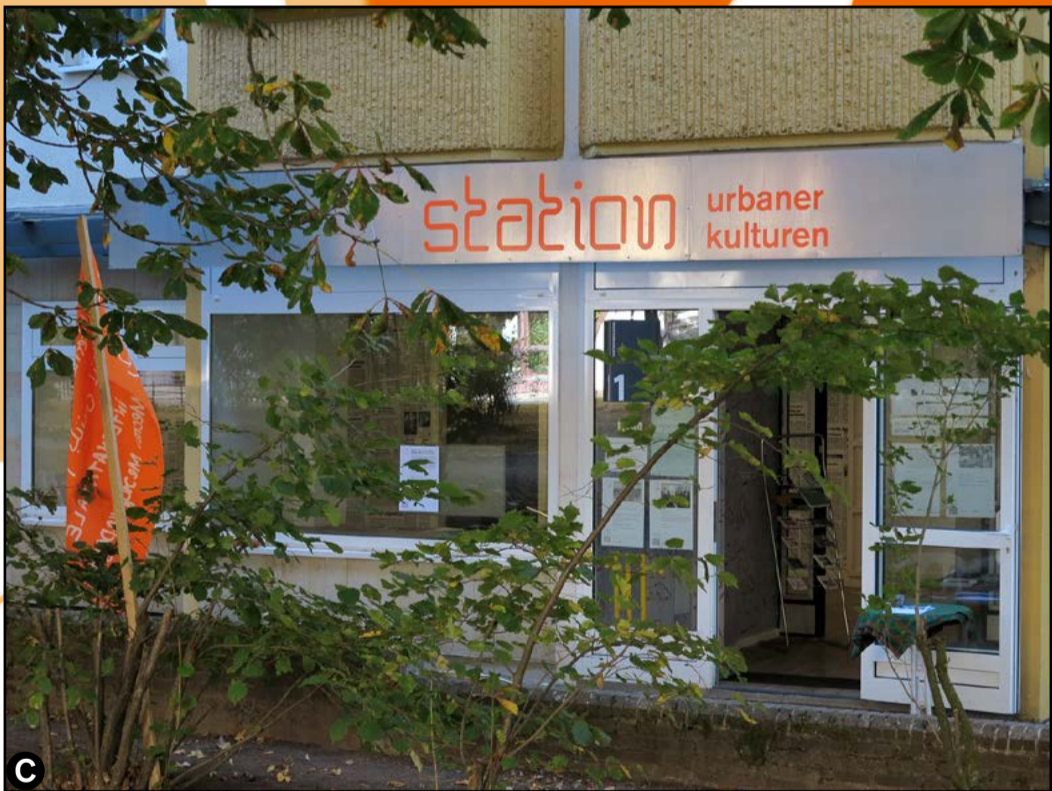
A Innenansicht Karl-Liebknecht-Straße 13, 2022 B Außenansicht Oranienstraße 25, 2021 C station urbaner kulturen / nGbK Hellersdorf, 2018